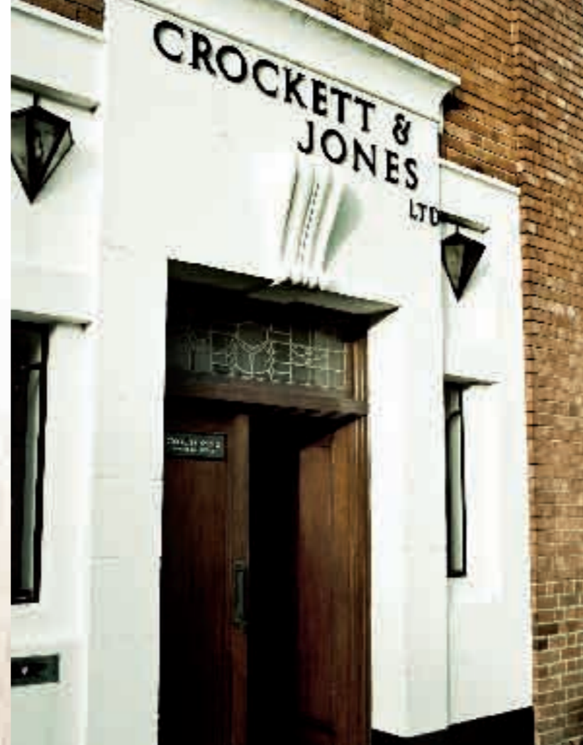
Den tegelklädda stålbyggnaden från 1859 blev 20 år senare Crockett & Jones fabrikslokal.