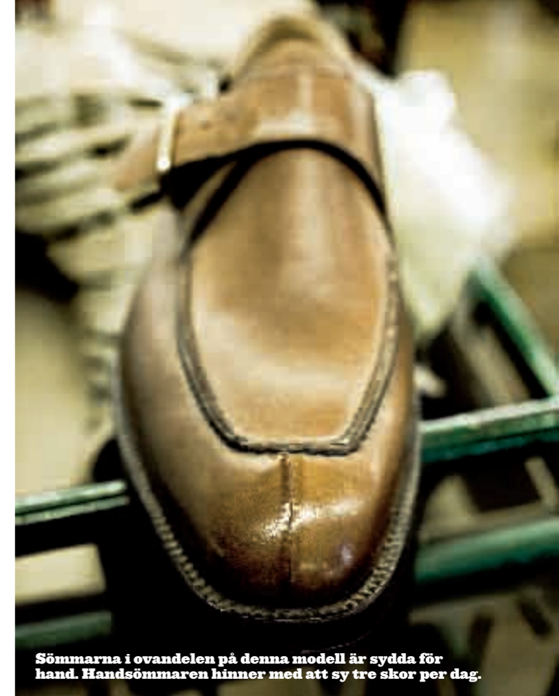
Sömmarna i ovandelen på denna modell är sydda för hand. Handsömmaren hinner med att sy tre skor per dag.