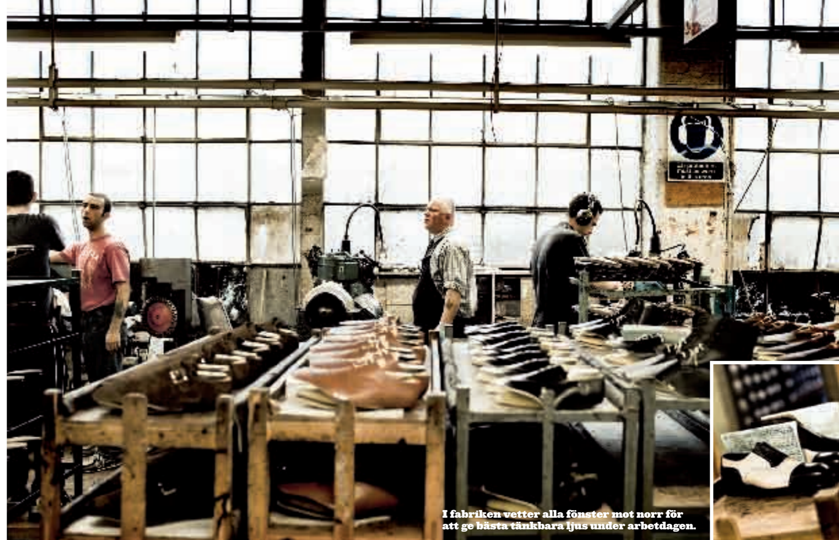
I fabriken vetter alla fönster mot norr för att ge bästa tänkbara ljus under arbetdagen.

pina som en drömtillvaro att befinna sig mitt bland hundratals 42:or som börjar ta mer och mer av golvet i anspråk. Oxfords, derbyskor, pennyloafers, hel- och halvbrogues, monk shoes, chelseaboots, jodphurs och kängor i svart, brunt, mocka, scotch grain, kalvskinn och krokodil.