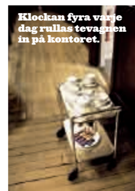
Klockan fyra varje dag rullas tevgagnen in på kontoret.