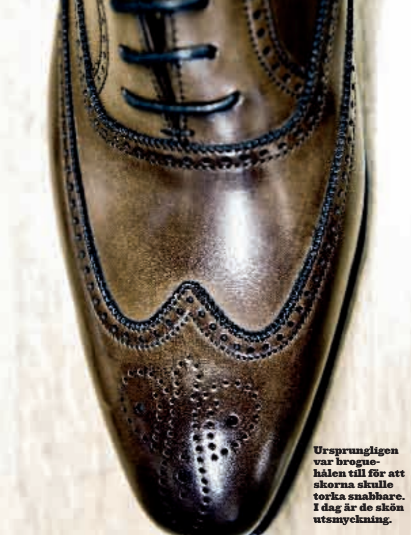
Ursprungligen var brogue-hålen till för att skorna skulle torka snabbare. I dag är de skön utsmyckning.