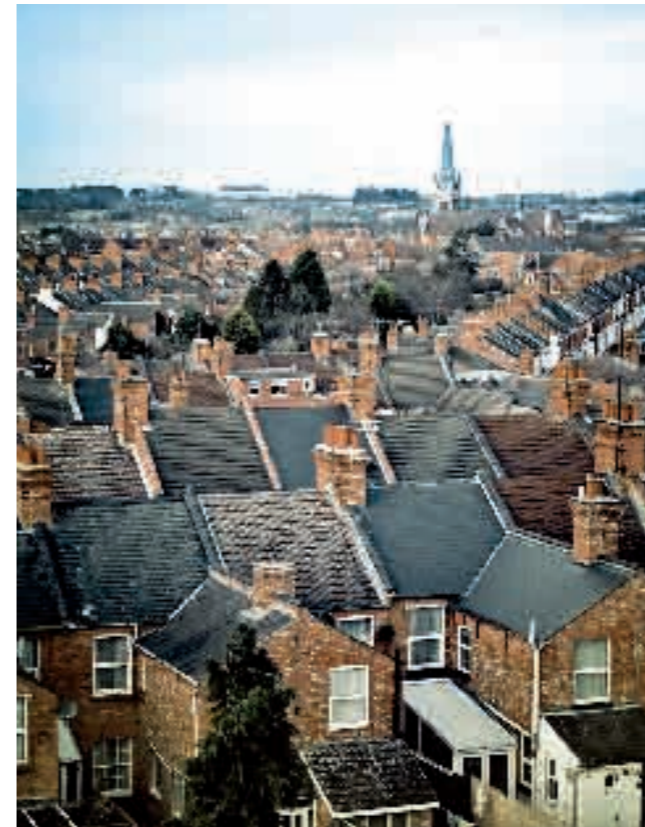
Från fabriken ser man Northamptons typiskt engelska röda tegelhus.